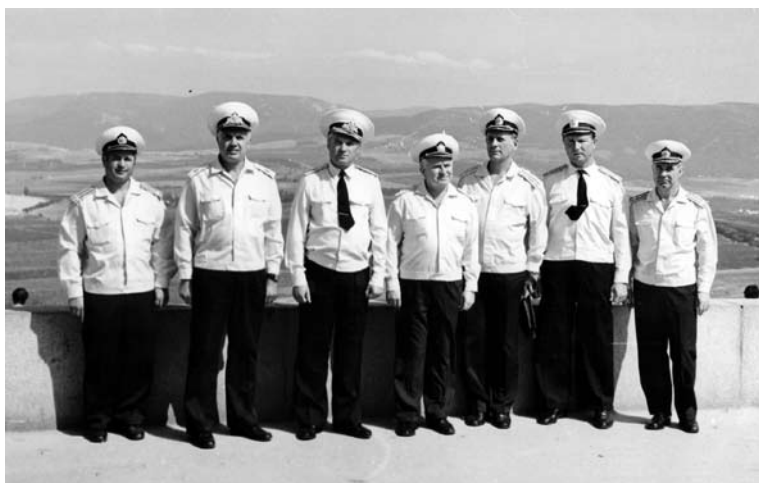
Снимка на площадката пред Севастополската панорама.