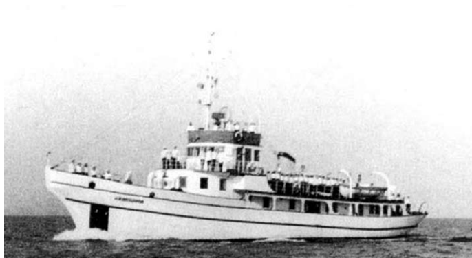
Учебен кораб „Н. Й. Вапцаров“

В Одеса освен срещата с ръководството на Института бяха проведени срещи с представители на сродни катедри, на които бяха обсъдени широк кръг въпроси на учебната и научната дейност. Подробно бяхме запознати с учебно-материалната база на института. Аз предимно се интересувах от обучението на студентите от различните специалности по използване на електронноизчислителните машини. В института имаше няколко ЕИМ. Обучението по ЕИМ не се различаваше съществено от обучението в Морско училище. За мен, а мисля и за всички, които участвахме в тази командировка, беше интересно да се запознаем с дейността на колегите ни. Струва ми се, че след това посещение в Одеския институт за инженери в морския флот се почувствахме горди, че в Морско училище учебната дейност е на достатъчно добро равнище.